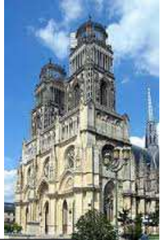
La Cathédrale Sainte-Croix d'Orléans

Orléans ist für unseren Austausch ein sehr attraktives Ziel, denn die historische Stadt liegt in der schlösserreichsten Gegend Frankreichs.