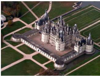
Le Château de Chambord

Die Teilnahme an einem Austausch bietet eine einmalige Erfahrung: Wo und wann sonst bietet sich die Gelegenheit, mal in Frankreich die Schulbank zu drücken? Und wie sieht eigentlich der Alltag bei 16/17Jährigen und ihren Familien in unserem Nachbarland aus? Ein Austausch gibt einen kleinen Einblick in die französische Lebensweise und zeigt kulturelle Gemeinsamkeiten und Unterschiede auf. Austausch bedeutet nicht zuletzt natürlich auch Kommunizieren - endlich werden die Sprachkenntnisse der letzten Jahre in authentischen Situationen angewendet.