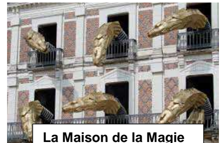
La Maison de la Magie

Wir werden vom 14. - 20 März 2020 nach Orléans reisen und unsere Austauschpartner werden uns vom 14. - 20. Mai 2020 in Marbach besuchen.